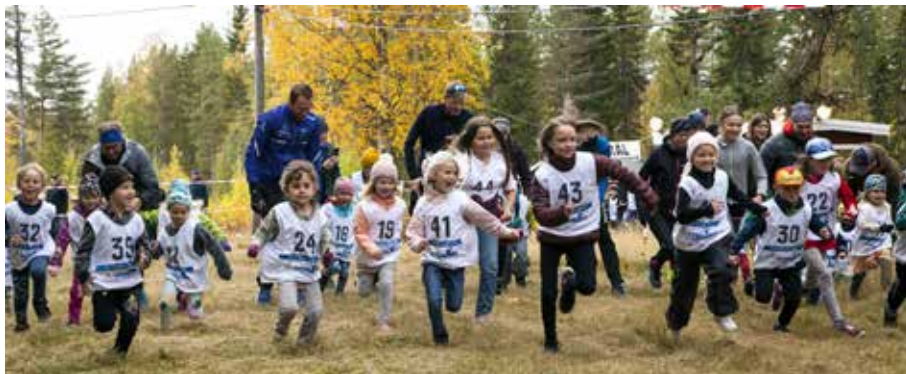
Tävlande i Miniutmaningen startar

Det är söndagsmorgon den 19 september och funktionärerna från EIF har samlats vid Gläntan för att ställa i ordning tävlingsplatsen inför Hemborgsutmaningen. Terrängtävlingen var föregående år en intern angelägenhet pga. pandemin och nu var det dags för en publik tävling.