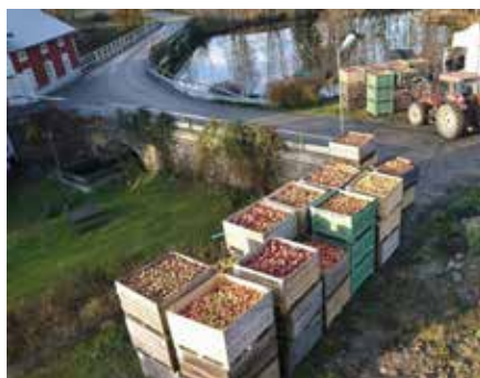
Ett antal äpplen innan mustning!