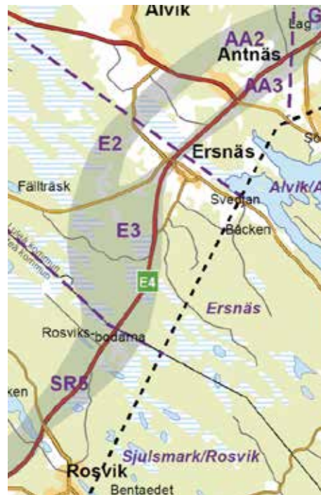
Det grå fältet visar planerad dragnings av Norrbotniabanan förbi Ersnäs, två alternativ finns, AA2 och AA3.