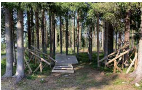
EIF:s utegym vid Gläntan

vid behov. Det får mig att tänka på Bamses ord "Är man stor och stark ska man också vara snäll". Det litterära ursprunget återfinns i Astrid Lindgrens bilderbok "Känner du Pippi Långstrump?" från 1947: "Då blir de bägge tjuvarna så rädda och börjar gråta. Pippi tycker synd om dem och ger dem var sin gullpeng att köpa mat för. För Pippi är snäll. Den som är väldigt stark måste också vara väldigt snäll". Devisen som Bamse och Pippi symboliserar skulle kunna vara ledstjärna för en del av världens ledare. Om de skulle följa dessa ord skulle världen se lite annorlunda ut både mänskligt och miljömässigt.