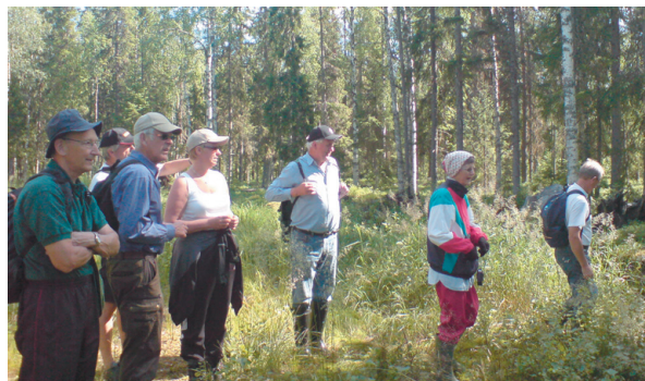
På väg mot Gagsträsket.