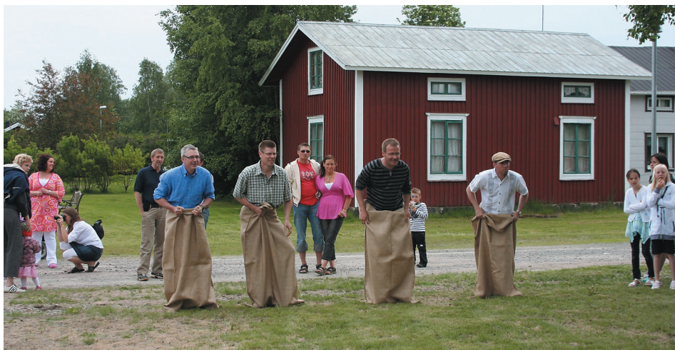
Några kämpar möttes på Torget vid midsommar.

rytmiska sång fick nära nog publiken att börja dansa.