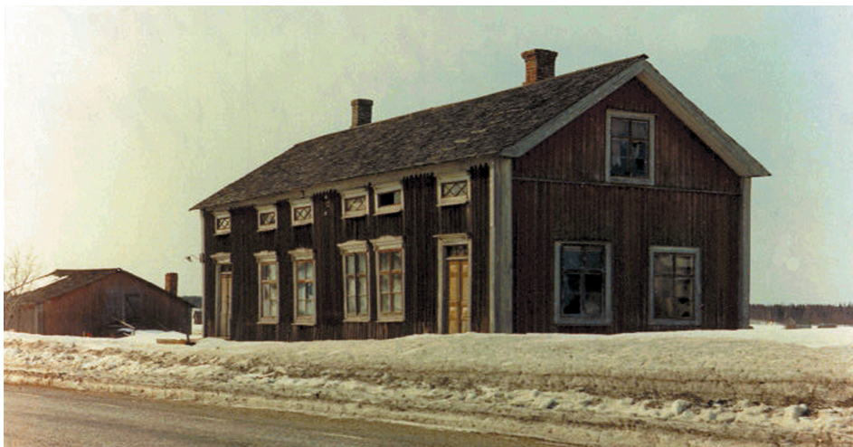
Ersnäs Gästgiveri