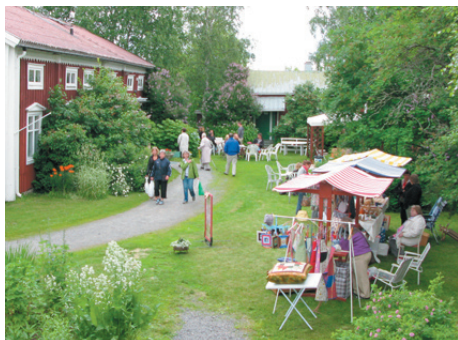
Ersnäsdagen vid Ralph Lundstengården

Ersnäsdagen. Detta är nu en tradition med åtskilliga år på nacken. Som vanligt var det många som mötte upp. En verklig höjdpunkt var sånggruppen Lusts framträdande på logen. Deras