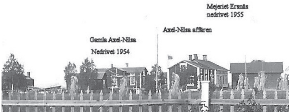
Gårdstället Axel Nils till vänster.