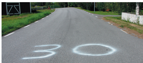
Ett "kom ihåg" till trafikanterna i byn

Det finns en s.k. portal som samlar alla byarnas hemsidor. Är Du intresserad av att studera vad som händer på andra håll, gå då in på www.byar.lulea.se