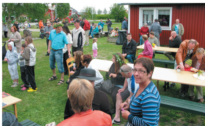
Midsommaren firas på Torget