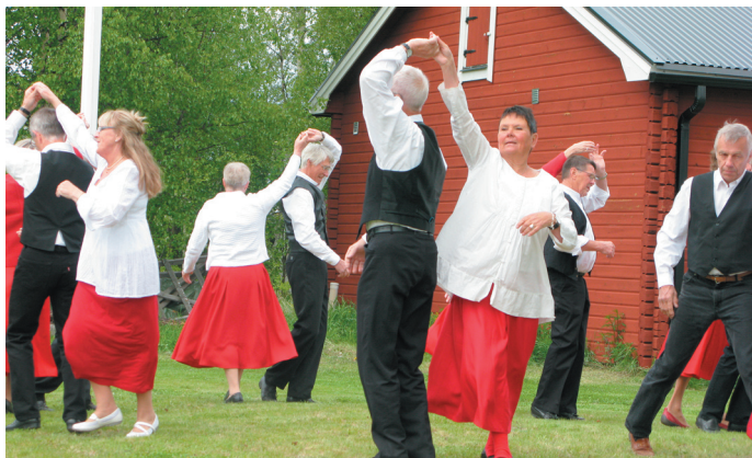
Dansuppvisning på Nationaldagen