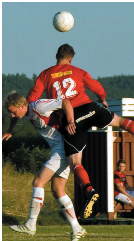
EIF huvudet högre vilket borgar för fortsatt kontrakt i div 4!