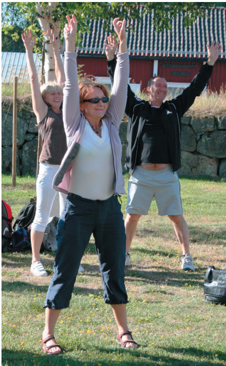
Morgongympa i Gammelstad, därefter seminarier.