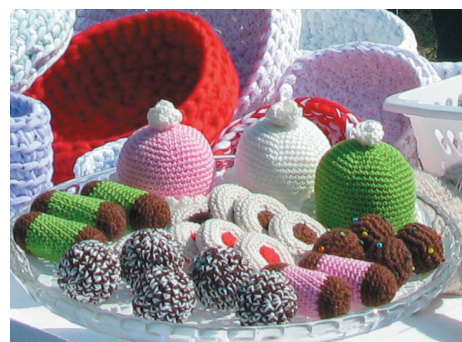
Även godbitar fanns att köpa på ett handarbetsbord