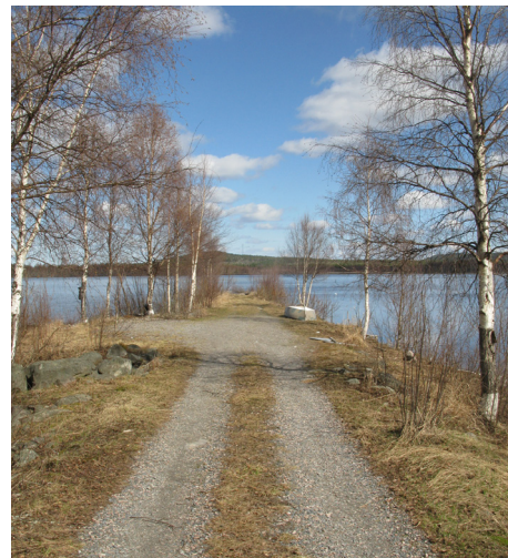
Resterna av Dålakajen en vårdag.

ställdes till det, var det möjligt för rätt stora båtar att gå in här. En reguljär ångbåtstrafik en bra bit in på 1900-talet upprätthölls mellan Luleå och Piteå med Dålakajen som en av angränsningspunkterna. Nu återstår endast en pir som befinner sig i ett något sorgligt tillstånd. Men även utan landhöjning hade båttrafiken upphört. Det är inte så lätt att konkurrera med våra dagar sätt att transportera folk och gods.