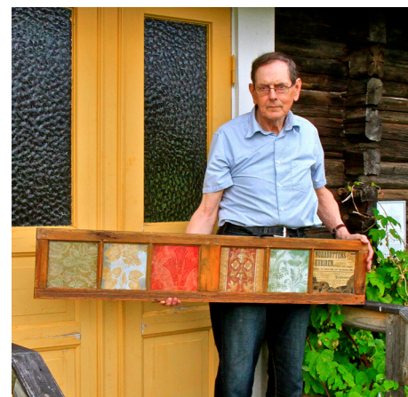
Folke med fönsterramen

Ett stort Tack från Hembygdsföreningen till er.