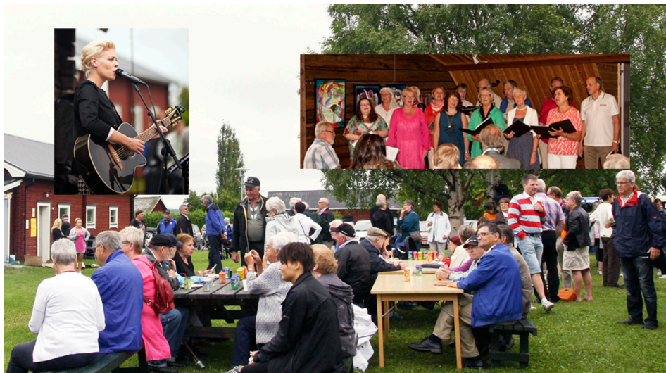
Ersnäsdagen genomfördes traditionsenligt med mat och underhållning på Torget samt Ralph Lundstengården.