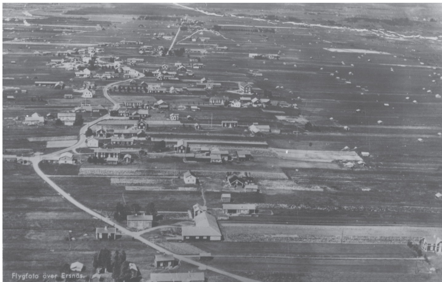
Flygfoto över Ersnäs.

Ersnäs IF Plusgiro 65472-3 Bankgiro 5970-5996