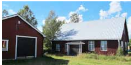
En färskare bild från Torget av Filadelfiahuset, till höger. Idag används det som möbellager av ägaren, Antnäs Möbler. Till vänster gamla Brandstationen.

samlingen i Luleå och verksamheten upphörde någon gång på 1960-talet. Huset står kvar på sin plats vid brandstationen på Torget.