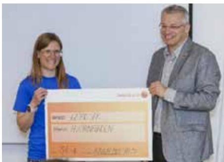
70 800 kronor överlämnas