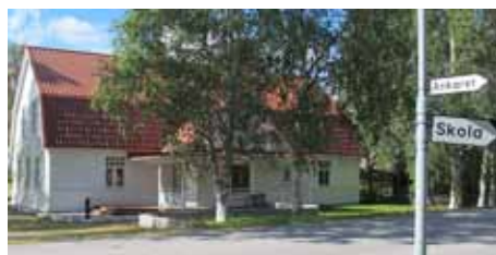
EFS-huset är numera ett upprustat boningshus

En verksamhet var också Solglimten där flickor samlades och handarbetade. Man läste också något passande vid dessa träffar.