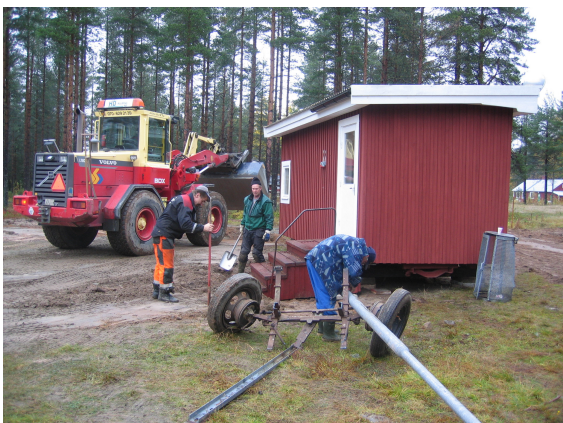
Ideellt arbete vid Skidstadion (Gläntan)

Följden av denna djärva insats blir med stor sannolikhet att Hääsch för första gången på många år nästkommande jul inte kommer att lysas upp av någon gran. Detta är självklart enbart av godo. De omkringboende gör en besparing och kommunen behöver inte längre lämna stöd till byn för att bekosta elen till granen. Generösa markägare får behålla sina granar och granansvariga personer behöver inte längre använda sin tid för dylika, ideella ändamål. Därför ett varmt tack till denna/dessa samhällsvälgörare!