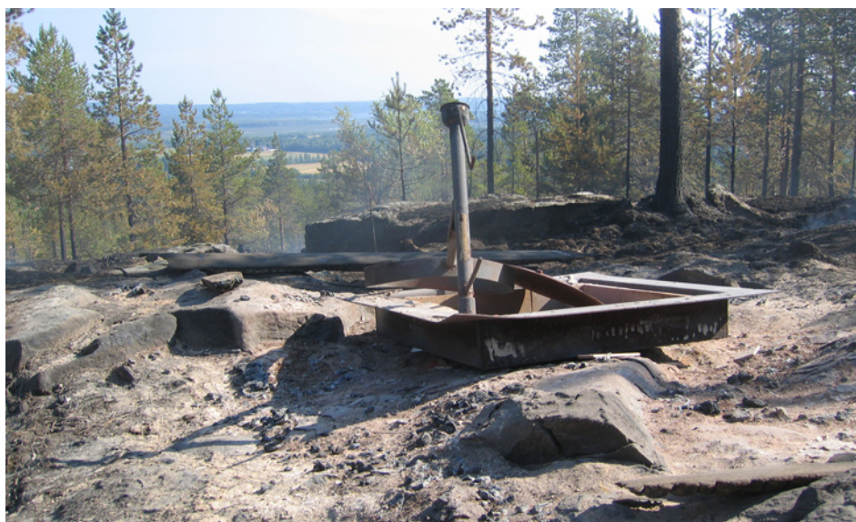
Resterna av grillplatsen.