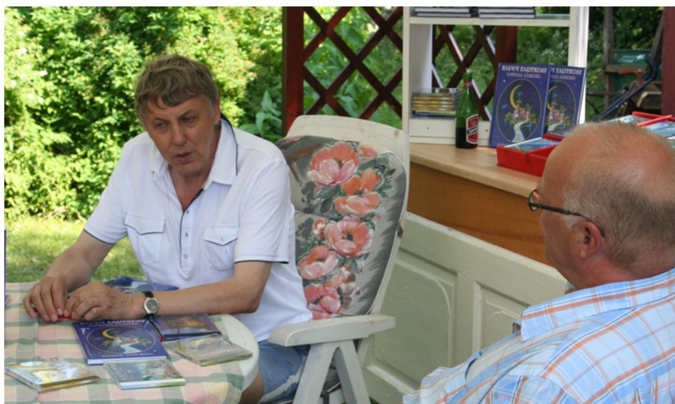
Ralph Lundsten signerade skivor och böcker till hugade fans. Här intervjuas han av lokalpressen.