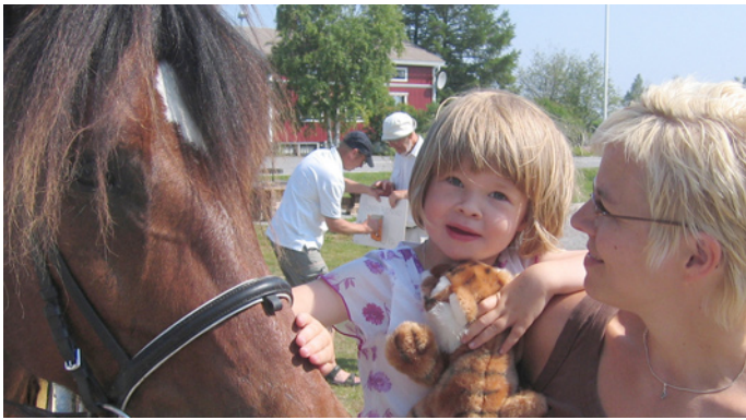
Hästskjuts och ridning var ett uppskattat inslag under Ersnäsdagen.