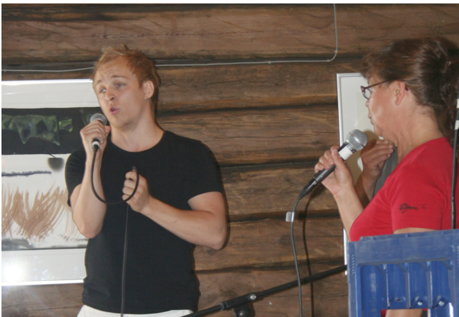
Delar ur Ersnästeatern underhåll i Logen på Ralph Lundstengården.