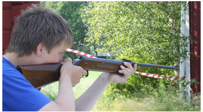
Ungdomar från Viltvårdsgruppen arrangerade en prickskytteävling.