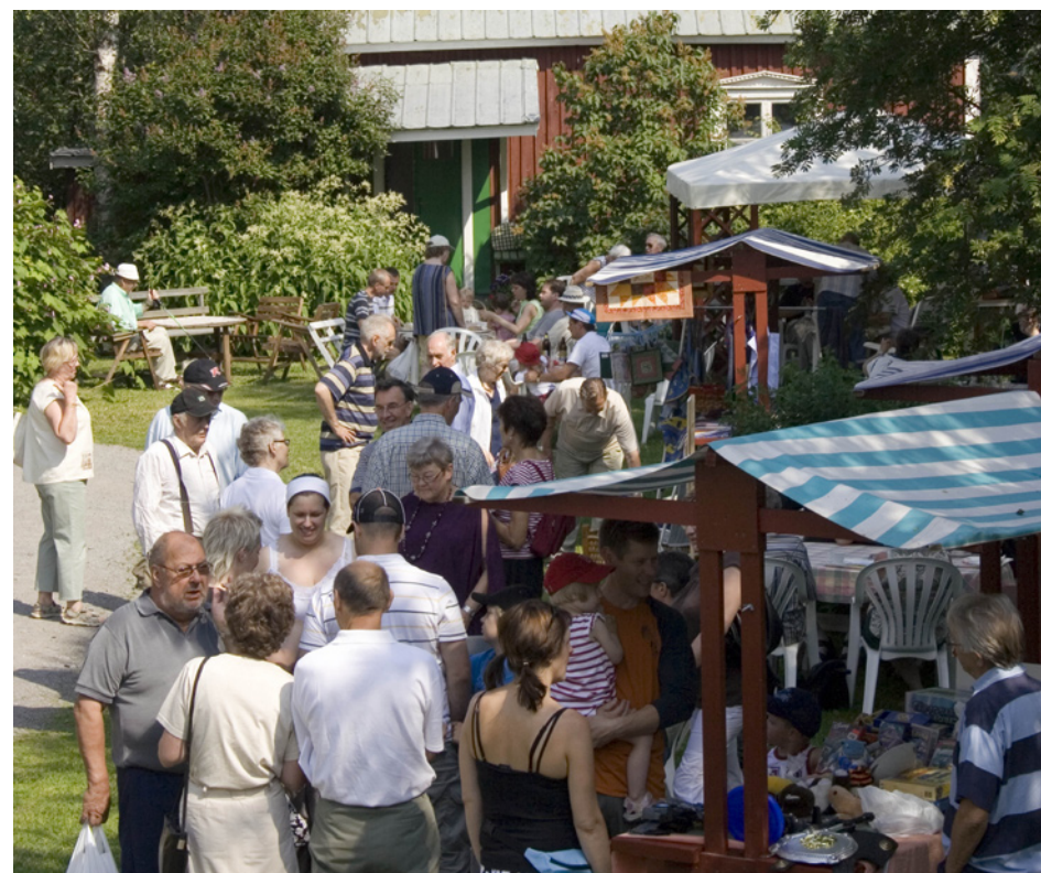
Kommersen i full gång vid Ralph Lundstengården.