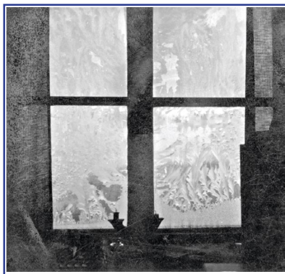
Insidan av mitt sovrumsfönster