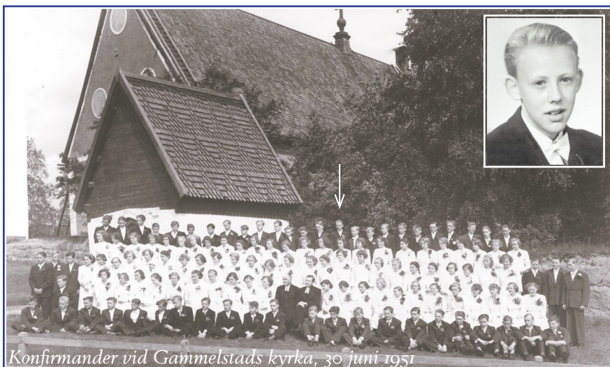
Konfirmander vid Gammelstads kyrka, 30 juni 1951

Men, konfirmation var inte så mycket en religiös längtan hos ungdomarna, som den stora möjligheten att träffa flickor från grannbyarna!